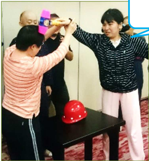
ピコピコハンマー！ 思いっきりやった！！