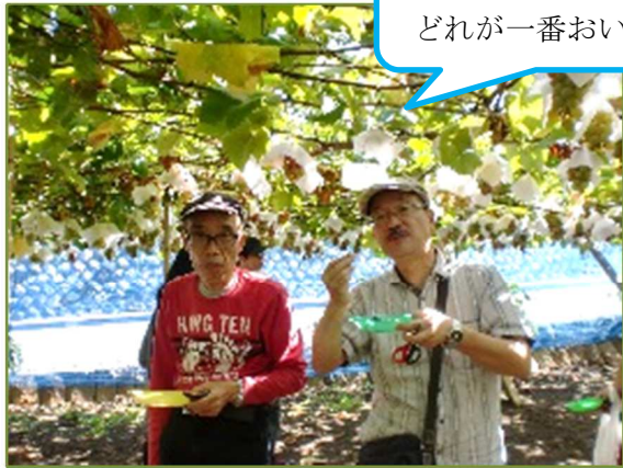
3種類を食べ比べ！ どれが一番おいしい？