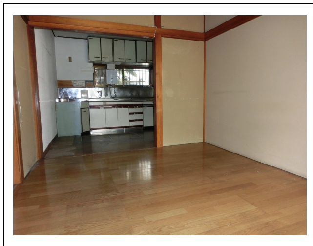
（荷物がなくなりガラんとした旧リビング）

6月1日（月）、旧ホームから徒歩5分のところにある仮物件への引っ越しが行われました。朝、旧ホームから普通にあらぐさへ出かけた入居者が仕事を終えて帰ってくるのは違う建物と