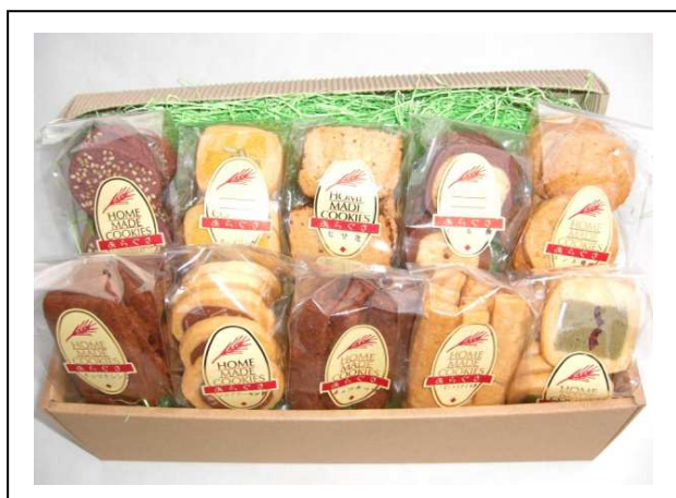
① 200円10個入り 2100円