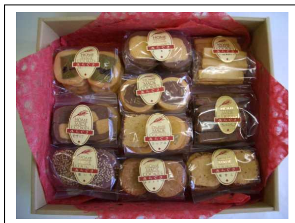
② 300円10個入り 3150円