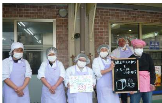
当日までのカウントダウン(こぼん)

2,800人が参加する大会です。会場代をはじめとして費用は約5000万円かかります。参加費だけでは賅えなく、多くの方に協賛金のお願いをしています。どうぞご協力をお願いいたします。